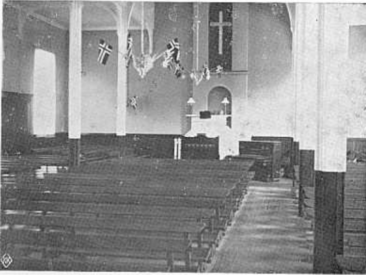
Gamle Bethel innvendig.

Slik så storsalen ut før ombygningen i 1957.