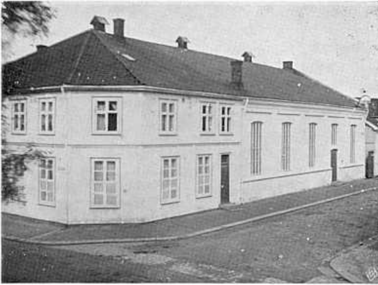
Bethel før oppussingen i 1951. Huset ble ferdig bygd i 1887 og innviet til bedehus samme år.

Lutherske linje. Særlig kommer dette frem i forbindelse med utleie av Bethel. Ingen fikk tale her som etter deres mening avvek fra den sunne lære.