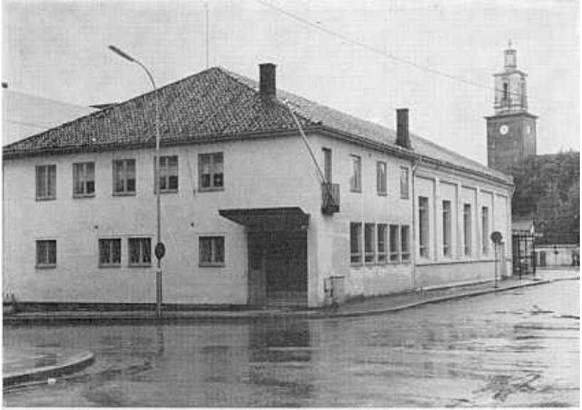
Bethel i dag.

Hva betydde dette? Skulle vi miste Bethel? Det ble forhandlet med kommunen og vi fikk høre at Stabburet skulle bygge bak Bethel og at Brochsgt. skulle utvides til full bredde.