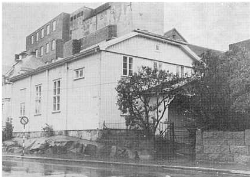
Bedehuset Carmel, hvor det hele startet.

la styret planer om å avholde oppbyggelsesmøter om søndagene på de mange og store sagbruk som da drev sin virksomhet i og rundt Fredrikstad. Over på Østsiden kom man tidlig i gang i leide lokaler og det varer heller ikke lenge før vi leser om regelmessige møter på Zoar, Kiærs bruk, Capjons bruk, Bjørnebys bruk og Røds bruk, samt hver 3. søndag på Veum. Dette allerede i 1876. Det året holdtes ca. 300 oppbyggelser.